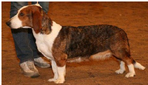
Hannhund (t.v.) og tisper av utmerket type, med utmerket helhet. Begge foto SDK