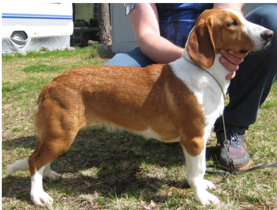
En noe høystilt tisper. (Steil front, vakkert hode).