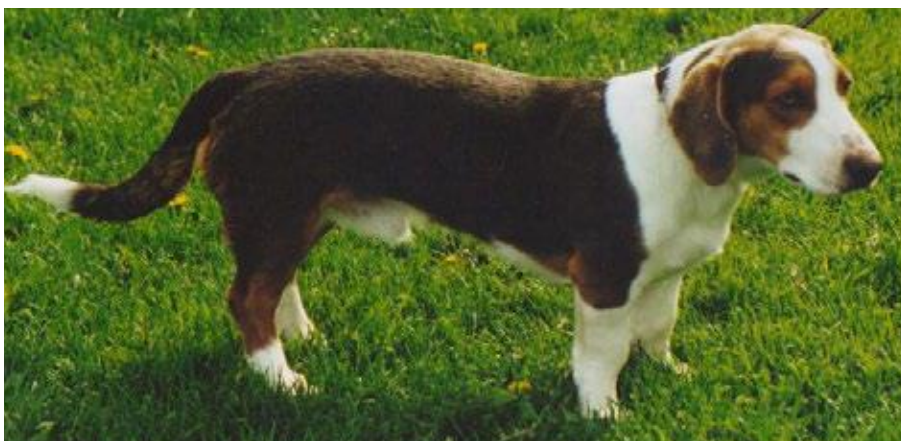
"Blå" hannhund med sadel som minner om fargen på luzernerstøver. OBS må ikke forveksles med leverfarge, som helt mangler svart pigment på tredeputene, klør, i munnen og på nesebrusken.