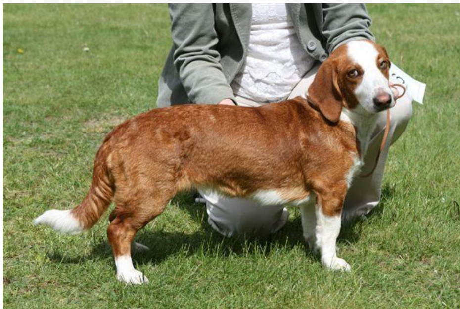
Tispe med steil front (og noe dårlig pigmentering på snuten).

Altfor steile skuldre og for korte overarmer er et problem i rasen. Dette kombinert med en åpen vinkel mellom skulderblad og overarm gir som regel en altfor kvadratisk og høystilt drever. Når halthet forekommer på frambein skyldes dette snarere det ovenfor beskrevne problem enn at frambeina er altfor «franske».