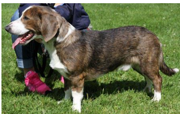
T.v. Tigret eller "brindlet" tisepe med helt ok farge. T.h. hannhund med farge som også er godkjent. Disse farg skal kun tas hensyn til i konkurransebedømmelse.