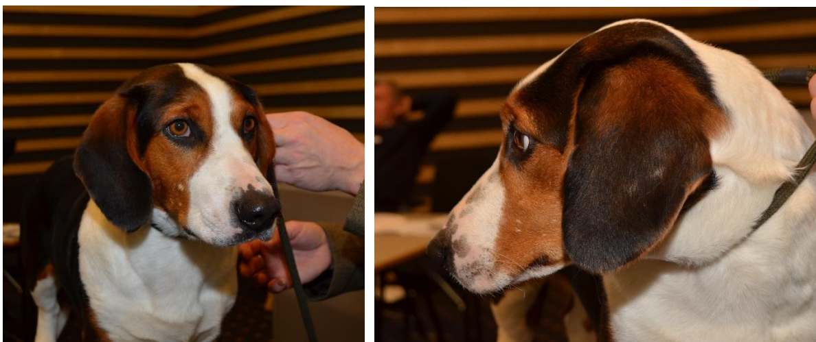
Et vakkert tisehode med avrundede ører, passe stopp, vakre øyne med et fint uttrykk og godt pigmentering på snute.