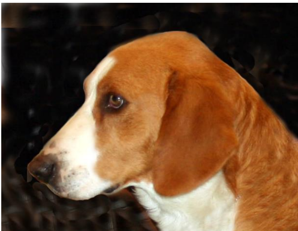
Vakkert hannhundhode.