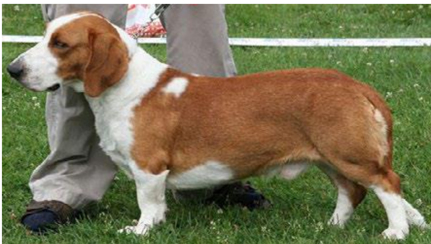
Hannhund. Hvit flekk som sitter i tilknytning til halsringen eller på fremre halvdel av kroppen kan få CK/Cert.