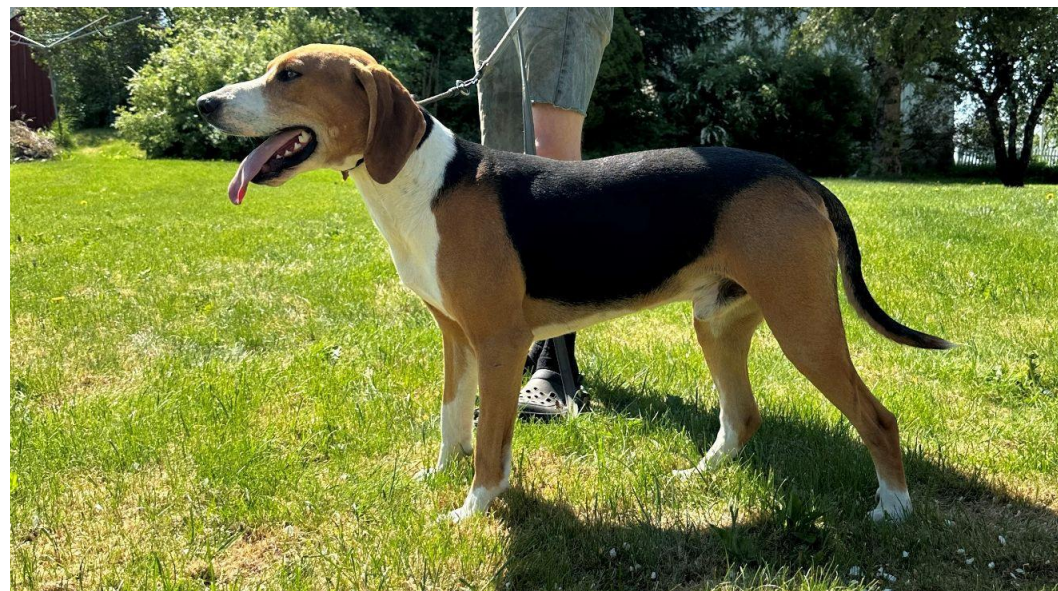
En krysningshund av 2. generasjon, med utpreget sort sadel som er feil i følge rasestandarden.

Vi ønsker ikke at 1.og 2.generasjons skal gis CK Hvis de er for høye eller har feil farge i henhold til standard. Men hvis farge eller høyde er den eneste feilen disse hunden har, kan de gis opptil Excellent grad.