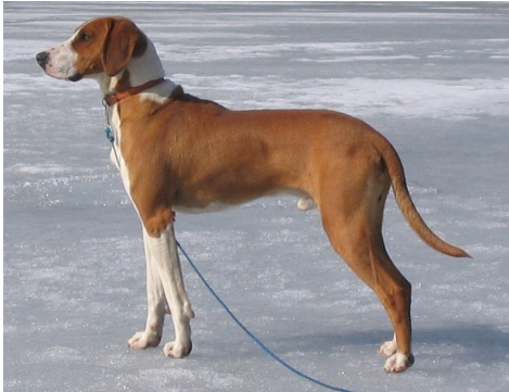
Noe langt snuteparti, noe bratt kryss og steil front.

Hunder som tilsvare rasens standard og hvis eksteriøre feil er av mindre fremtredende karakter.