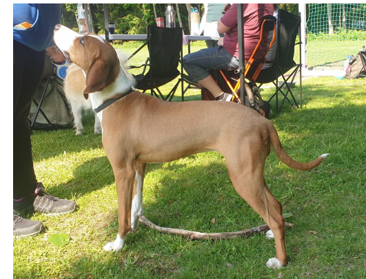
Juniortispe med noe avfallende kryss og noe understilte bevegelser trenger utvikling.