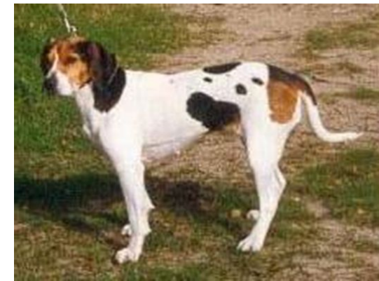
Hvit med sorte og brune tegninger. Sjelden å se.