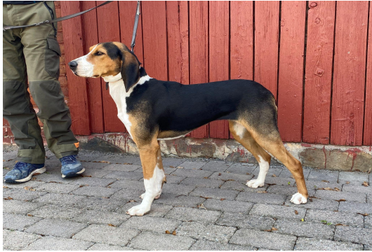
Noe lang kropp og lange ører, et noe dunkerpreget hode.