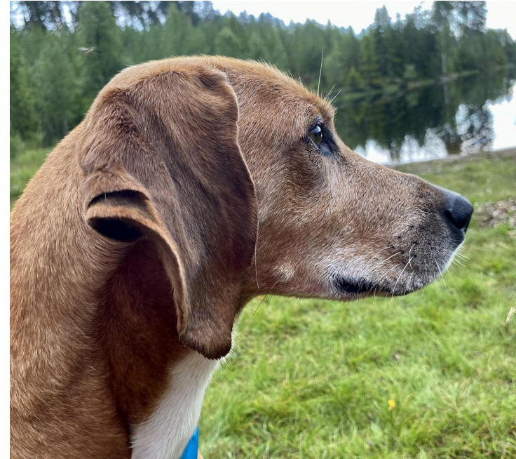
Utmerket hannhundhode. Kileformet godt hvelvet skalle. Korrekt lengde og dybde på snuteparti. Mørke fine øyne.