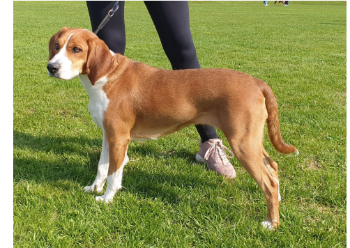
Litt store ører, noe kort hals, noe fremskutt front og avfallende kryss. Noe lyse øyne.

Hunder som tilsvare rasens standard og hvis eksteriøre feil er av mindre fremtredende karakter.