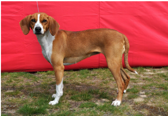
Meget god type , kunne hatt noe bedre bakkensvinkler

Hund som godt tilsvare rasens standard, som er velbalansert og i god kondisjon. Mindre feil kan tolereres, men ingen som negativt påvirker helhetsinntrykket. Denne premien kan gis til hund som er av meget god kvalitet.