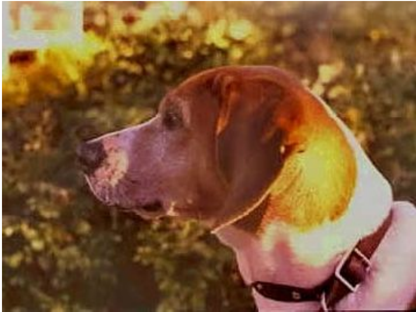
50 år gammelt korrekt Hygenhode. ( før innkryssingen.)