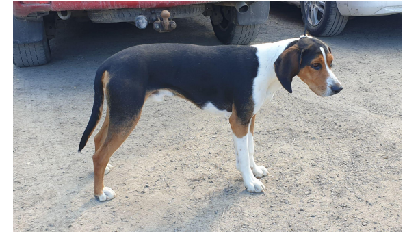
Noe bratt kryss, understilte bevegelser pga. litt dårlig vinklet bak.

Hund som godt tilsvare rasens standard, som er velbalansert og i god kondisjon. Mindre feil kan tolereres, men ingen som negativt påvirker helhetsinntrykket. Denne premien kan gis til hund som er av meget god kvalitet.