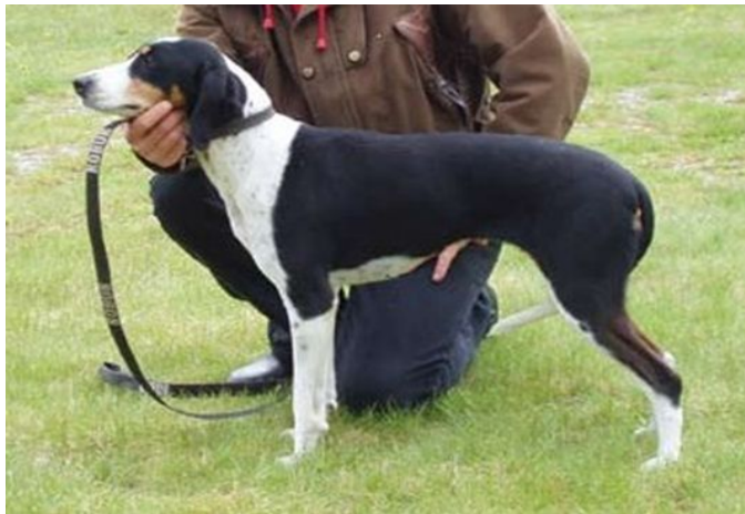
Sort/hvit ofte med brune overganger