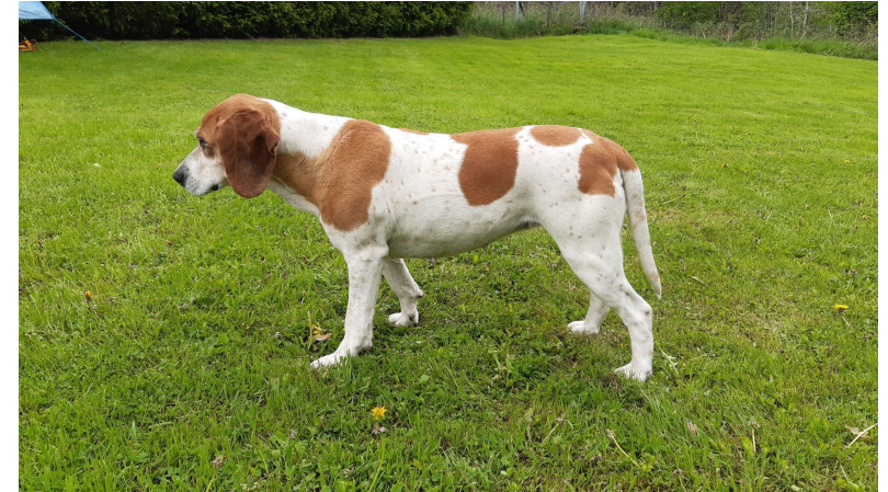
Hvit med brune tegninger.