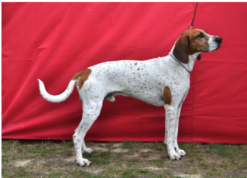
Noe langt hode med flat skalle. noe lang lend og avfallende kryss, Høy krum haleføring.