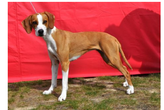
Lett juniortispe, vil vokse seg bedre.