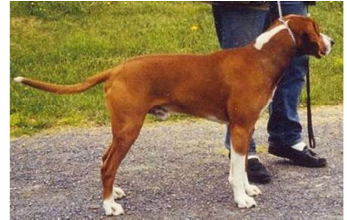
Særdeles fin rødbrun farge