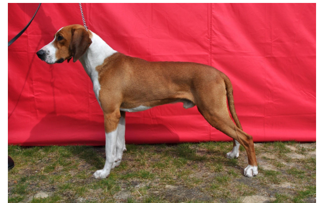
Flott rødbrun type.